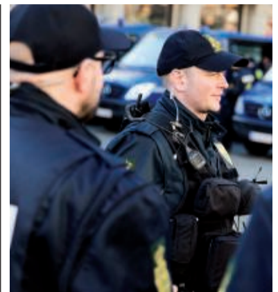
Københavns Politi opgiver at opklare mange indbrud.

HVIS MAN IKKE har nogen pårørende, eller de ikke har tid, så må man tage hensyn til det. Vi skal tage hensyn til den enkeltes situation, for nogle har et netværk og muligheder for at få hjælp der, mens andre ikke har. Vi behandler ikke alle patienter som én ensartet brik.